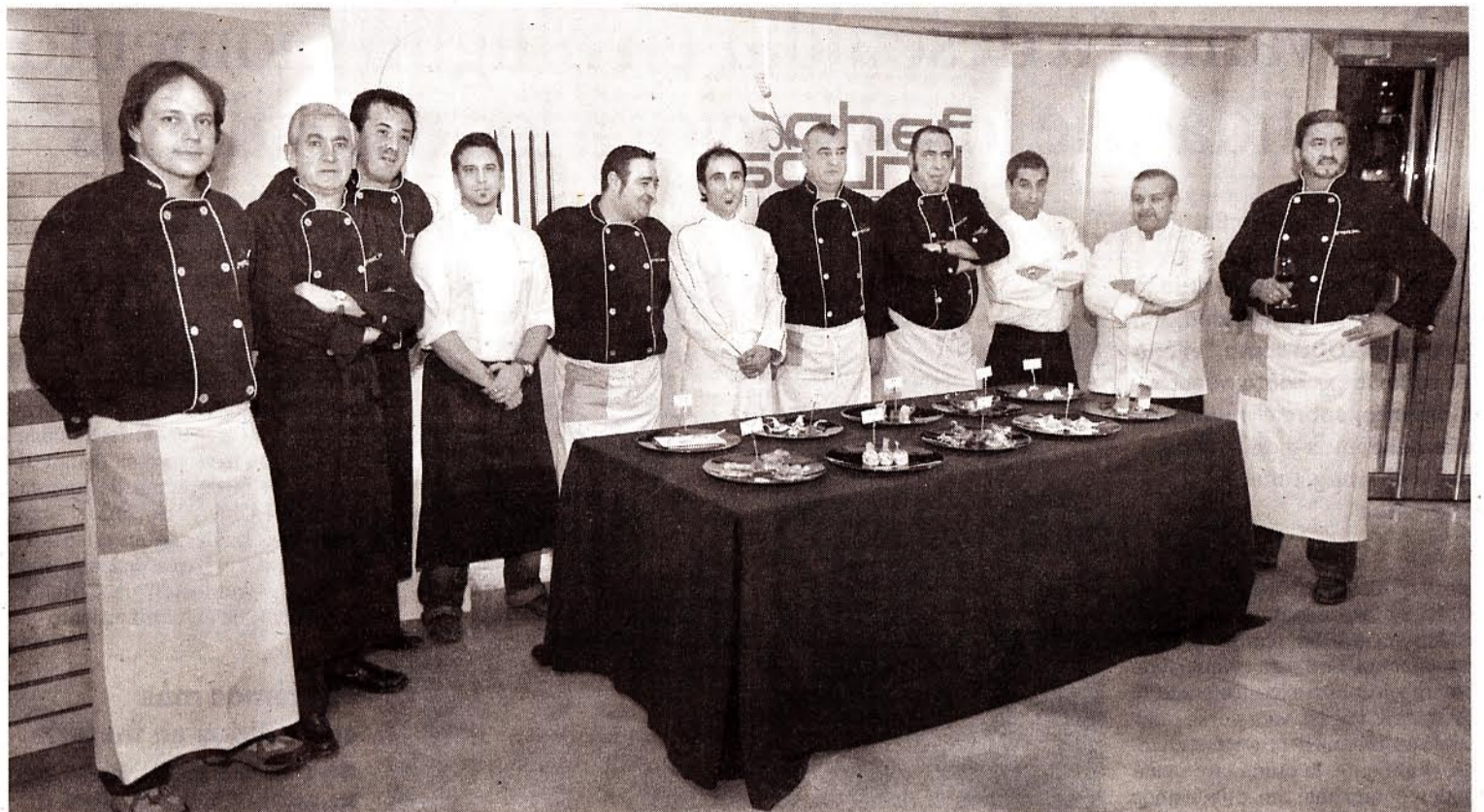
Una representación de los cocineros que tomarán parte en el festival que convertirá a Bilbao en capital gastronómica.

Ya retumban los tambores... El Chef Sound Bilbao-Bizkaia, heredero de los festivales Taste, se celebrará entre el 11 y el 14 de junio, en la explanada del Museo Marítimo, ante más de 15.000 personas.